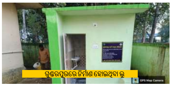
ଗୁଣ୍ଡେରପୁରରେ ନିର୍ମାଣ ହୋଇଥିବା ଲୁ