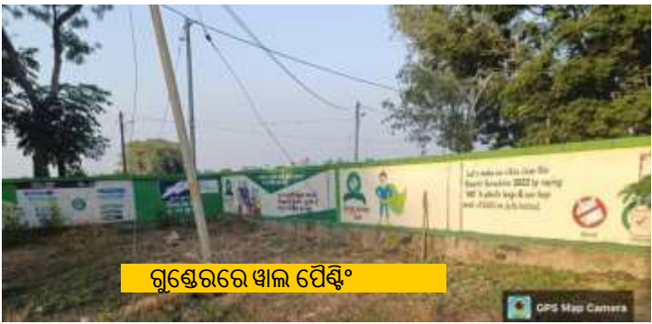
ଗୁଣ୍ଡେରରେ ଖାଲ ପୈଣ୍ଟିଂ

୩୧ ଅକ୍ଟୋବର ୨୦୨୨: ମୁଖ୍ୟମନ୍ତ୍ରୀ କର୍ମ ତତ୍ପର ଅଭିଆନ୍ (ମୁକ୍ତା) ଚିମ୍ ଅଧୀନରେ ସମସ୍ତ ୧୨୯୩ଟି ବର୍ଷା ଜଳ ଅମଳ ବ୍ୟବସ୍ଥା ନିର୍ମାଣର ଲକ୍ଷ ଶେଷ କରିଛି । ଏହି ଚିମ୍ ଅଞ୍ଚଳର ନୋଡାଲ୍ ଅଧିକାରୀଙ୍କ ଦ୍ୱାରା ପ୍ରକଳ୍ପ ଯାଞ୍ଚ ପ୍ରକ୍ରିୟାରେ ଅଛି । ଏହି ଯୋଜନା ମିଶନ ଶକ୍ତି ଗୋଷ୍ଠୀକୁ ଆର୍ଥିକ ଦୃଷ୍ଟିରୁ ବୃଦ୍ଧି କରିବା ସହିତ ଭୂତଳ ଜଳଭଣ୍ଡାରକୁ ଚାର୍ଜ କରିଛି ।